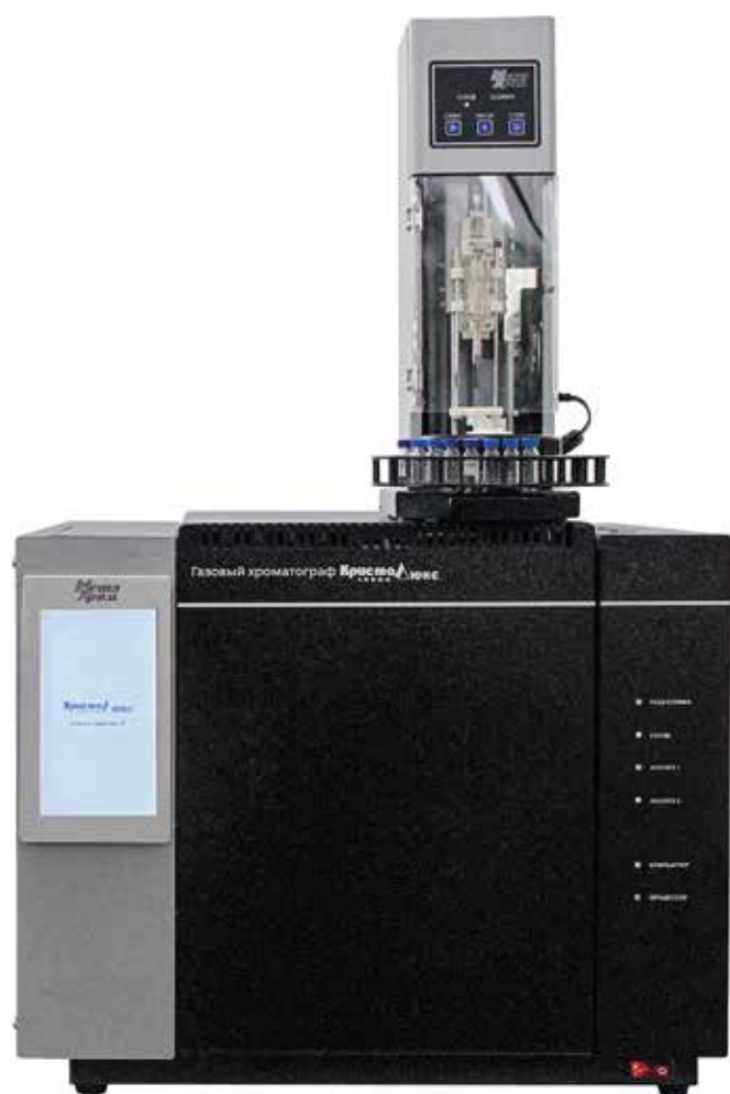
Современный хроматограф «Кристаллюкс-4000М», выпускаемый фирмой НПФ «Мета-хром»

и в 1988 году их труд был отмечен медалями ВДНХ (золото и серебро), почетными дипломами.