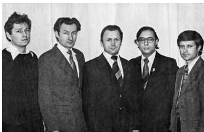
Первый состав сотрудников отдела