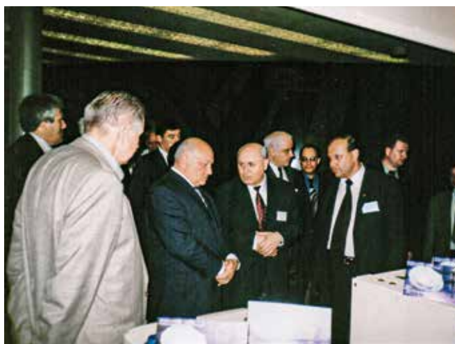
На выставке, посвященной 100-летию открытия хроматографии, Москва, 2003 год