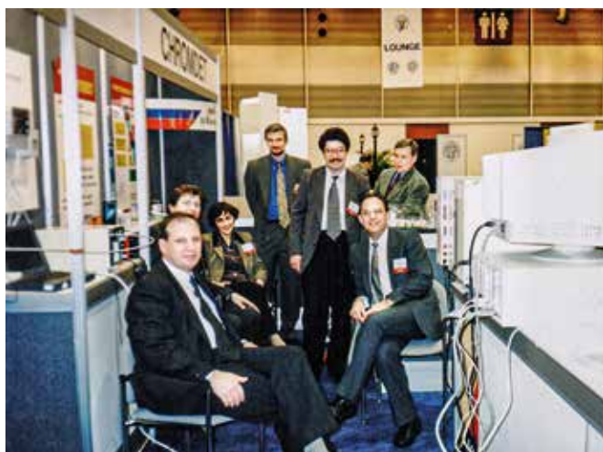
На выставке «PITTKON-98» Новый Орлеан, 1998 год